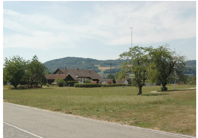
Zukünftiger Standort am Generationenweg

Ab sofort können sich Interessierte auf die Interessentenliste der Casa Hubpünt eintragen lassen. So erhalten Sie aus erster Hand Informationen rund um die Planung und den Bau der Casa Hubpünt.